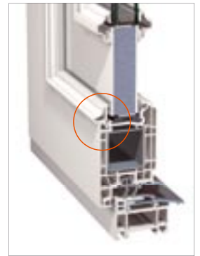
Detail Glasleiste Stil