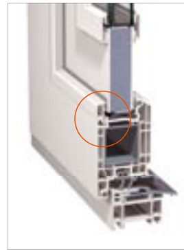
Detail Glasleiste Classic-line